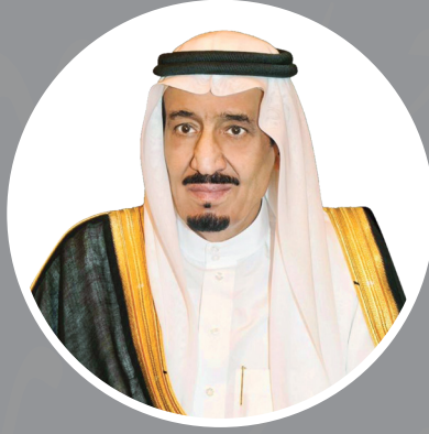
خادم الحرمين الشريفين الملك سلمان بن عبد العزيز آل سعود