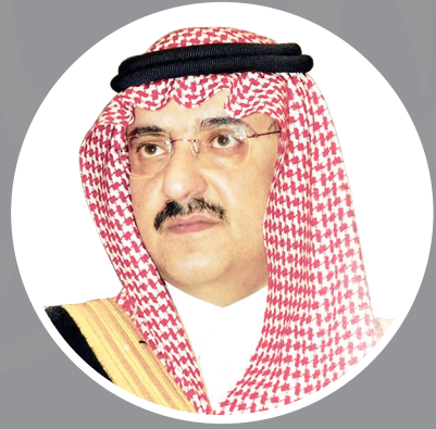
ولي العهد صاحب السمو الملكي الأمير محمد بن نايف بن عبد العزيز آل سعود