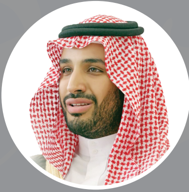
ولي ولي العهد صاحب السمو الملكي الأمير محمد بن سلمان بن عبد العزيز آل سعود