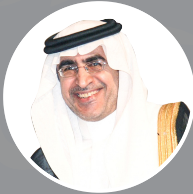
معالي وزير التعليم د. عزّام بن محمد الدخيل